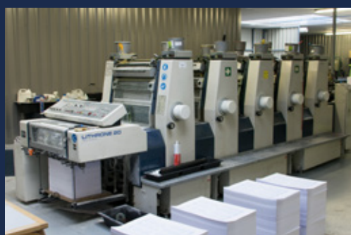
KOMORI impression format : 450 x 320 mm