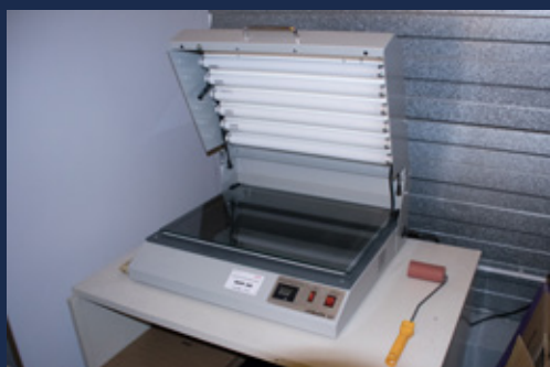
METAL PHOTO Impression par insolation format : 500 x 300 mm