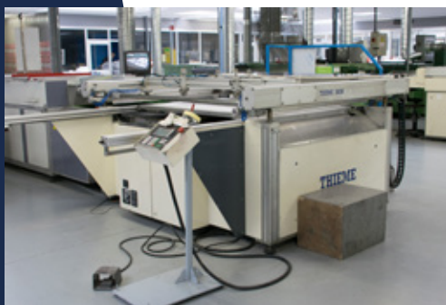
THIEME 3030 Sérigraphie format : 1 300 x 1 200 mm