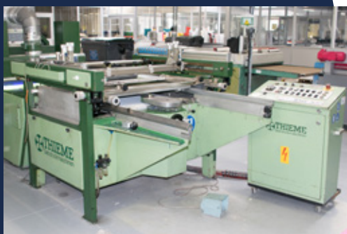
THIEME 3010 Sérigraphie format : 700 x 500 mm