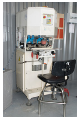
TAMPOPRINT Impression sur objets en volume