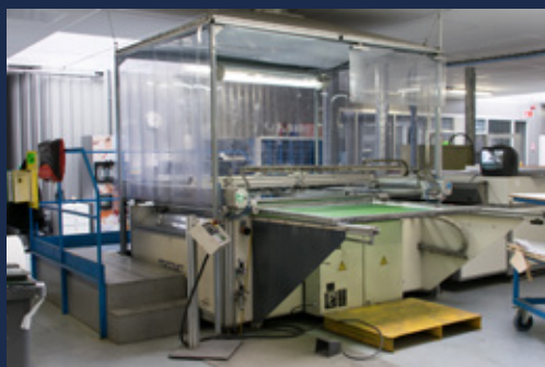
THIEME 3040 Sérigraphie format : 1 500 x 1 200 mm