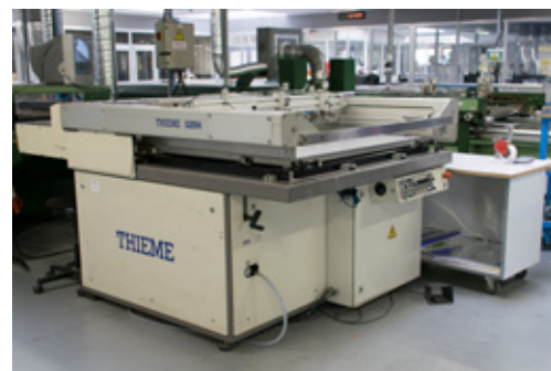
THIEME 520H Sérigraphie format : 700 x 500 mm