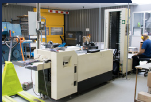
Assemblage & pliage

division communication de la société SOFOP S.A.S. taliaplast® Société Française d'Outils Professionnels S.A.S. au capital de 10 000 000 euros SIREN 006 780 514 / APE 2229B / N° TVA FR 72 006 780 514