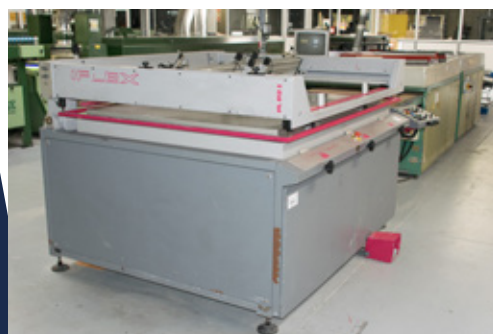
TIFLEX Sérigraphie format : 1 000 x 700 mm