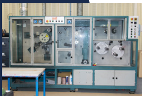
SIAT Impression sur rubans